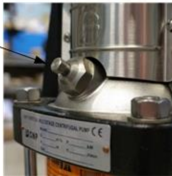
Рис.8 Пробка воздухосборника.