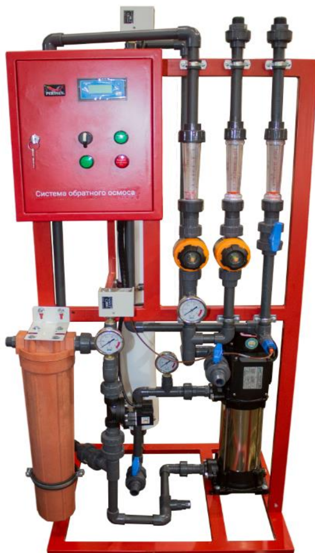
Рис.1 Общий вид установки.