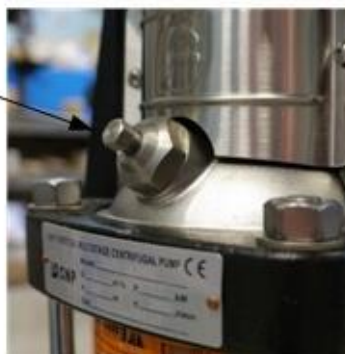
Рис.8 Пробка воздухосборника.